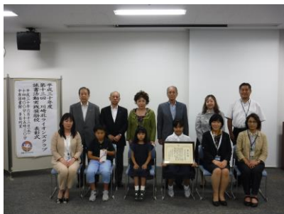
—真福寺小の児童と記念写真—

6月13日（水）に、川崎北ライオンズクラブ主催の「第13回読書活動実践奨励校の表彰式」が中原図書館多目的室で行われました。児童生徒の日ごろの読書活動の取組が評価され、今年度は真福寺小学校・田島中学校・稲田中学校の3校が表彰されました。