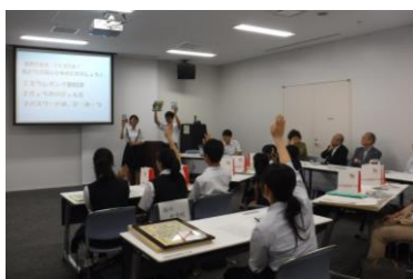
—田島中の発表の様子—

表彰後には、各校の図書委員会の児童生徒の代表が、それぞれの特色を生かした読書活動の取組について発表しました。3校とも「読書の楽しさを伝えたい」という思いにあふれた内容で、児童生徒による創造的な読書活動推進の様子が、聞き手にもよく伝わりました。