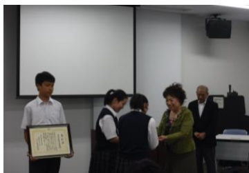
—稲田中の表彰の様子—