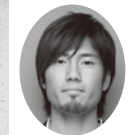
DF8 小宮山 尊信

あさのあつこ/作 佐藤真紀子/絵 教育画劇 1996～2005年 剛速球投手巧(たくみ)と捕手の豪(こう)。自信の強い巧と優しい豪はぶつかり合い、悩みながらも互いの野球への思いは断ち切れない。二人は最高のバッテリーになれるのか。思春期の少年たちの最高に熱い物語！