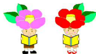
川崎市立図書館キャラクター