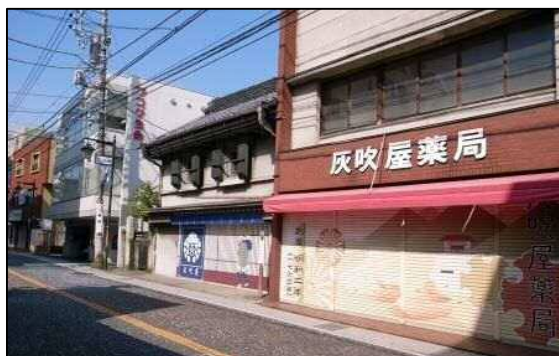
薬局「灰吹屋」(はいふきや)

江戸時代から続く灰吹屋薬局。隣の土蔵は、明治時代に建てられ昭和 35 (1960) 年までお店として使われていました。