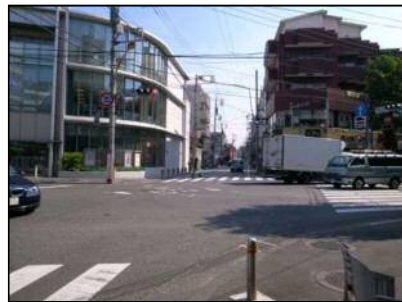
府中街道との交差点 「高津」