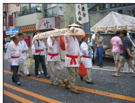
大山街道納め太刀担ぎ