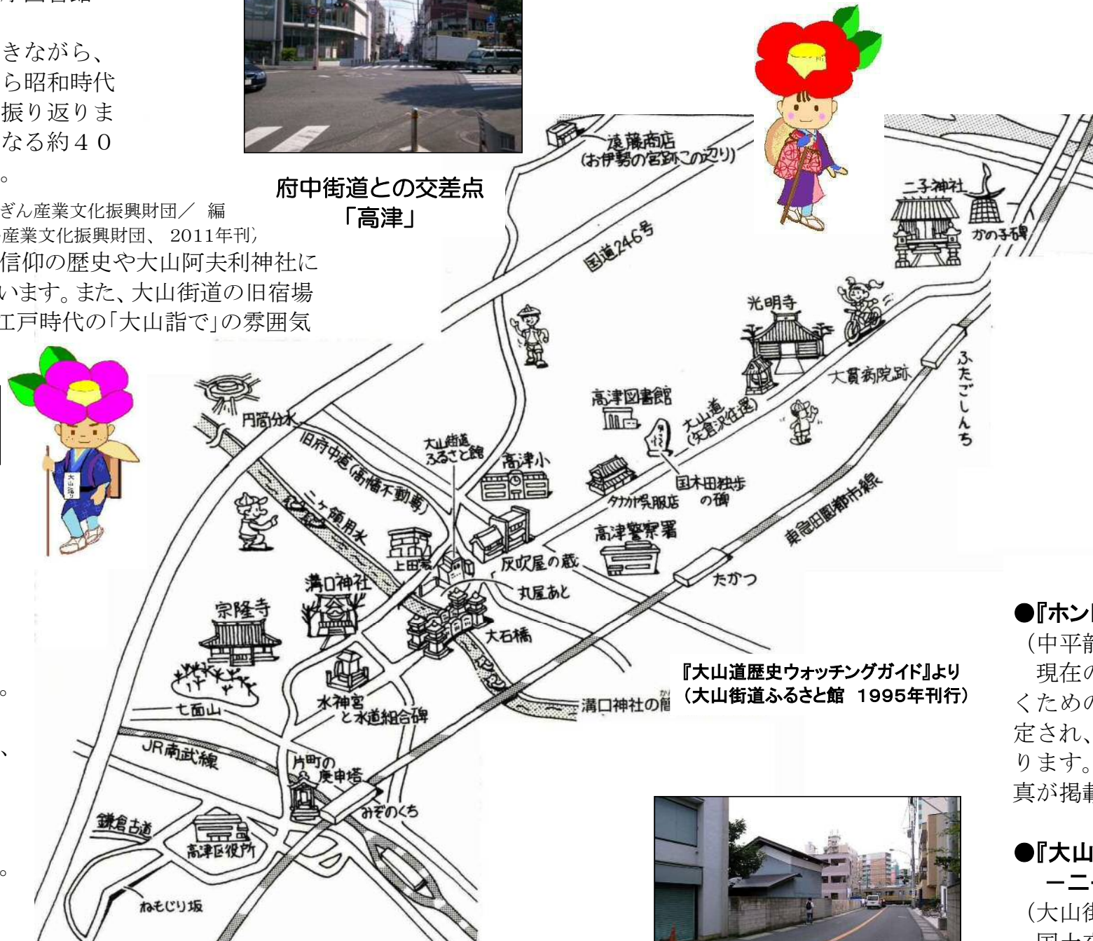
『大山道歴史ウォッチングガイド』より (大山街道ふるさと館 1995年刊行)