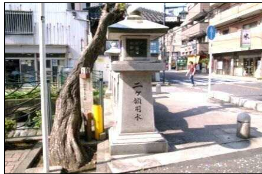
二ヶ領用水 石灯籠

(川崎市立高津図書館／著 川崎市立高津図書館 1992年刊、1993年刊) 第14篇は二子・溝口宿の近代(明治・大正)建築部分が残存している商家の調査報告です。これまでの『高津郷土史料集』矢倉沢往還シリーズが、調査者が具体的に見聞した素材の記録であったのに対し、第15篇は古老の聞き取りを元にしており、豊富な写真・絵図などを用いた記録化のための工夫がされています。第15篇刊行時には、第14篇で取り上げられた商家30軒の半数近くが取り壊されていました。