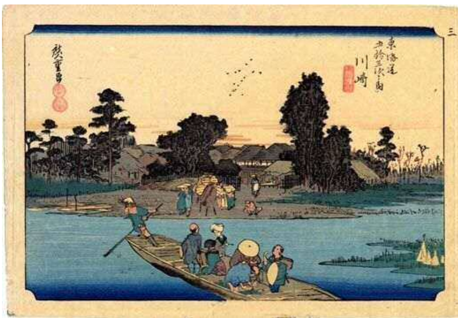
『東海道五拾三次之内川崎 六郷渡船』

佐藤本陣・田中本陣、万年屋跡や川崎宿内にあった神社、寺院、小土呂橋など川崎宿に関連した施設、史跡について、由来や現在の状況などがていねいに説明されています。最近の現地の写真や昔と現在の地図なども掲載されており、川崎宿に興味を持った方が最初に手にとって読むのに適したガイドになっています。