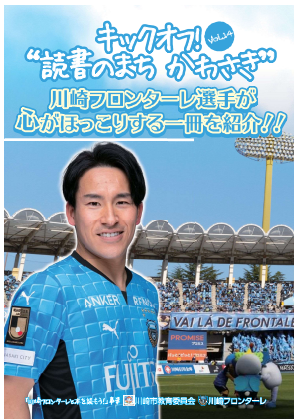
リーフレット表紙

「キックオフ！読書のまち かわさき」(リーフレット)の発行は今年度で14年目となりました。今回のテーマは「心がほっこりする一冊」です。今年は、川崎フロンターレがクラブ創設26周年と、Jリーグでは唯一「フロ」が付くクラブ名を持つフロンターレにとっては、記念すべき年です。