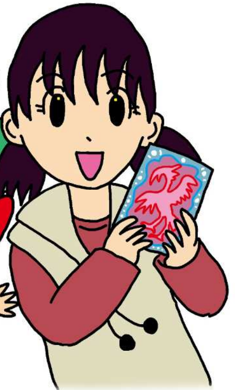
おねえちゃん (小学6年生)