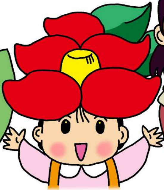
としょかんキャラクター つばぎちゃん